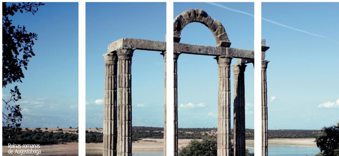
Ruinas romanas de Augustobriga