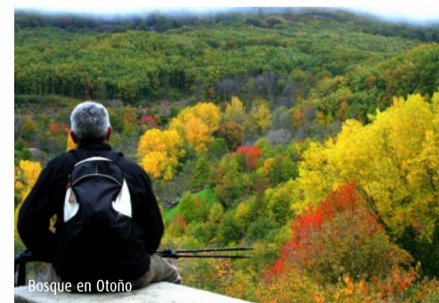
Bosque en Otoño

Límites: situada al norte de Extremadura, limita al este con el valle del Jerte, al oeste con Las Hurdes y Granadilla, al sur con Plasencia y al norte con la sierra de Béjar.