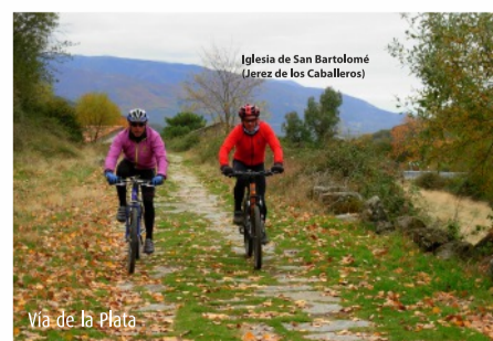
Vía de la Plata