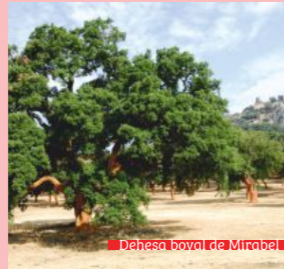
Dehesa boyal de Mirabel

Tenera, cordero, carnes de caza y embutidos típicos de la dehesa. Platos como la caldereta de cabrito y de venado, además de productos silvestres de temporada como los espárragos, setas y criadillas de tierra. También dulces artesanos como las floretas o los huesillos.