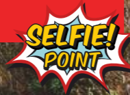
Garganta del Fraile

La reserva posee dos áreas claramente diferenciadas: una zona central definida por los cauces de los ríos Tajo y Tiétar y una cadena de sierras que ha dado lugar a un monte mediterráneo cerrado.