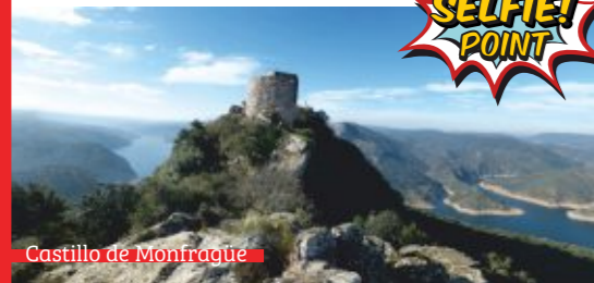
Castillo de Monfragüe

Declarado en el año 2007, en el Parque Nacional de Monfragüe conviven dehesas, bosque mediterráneo y los relieves que los ríos Tajo y Tiétar tallan a su paso, dejando profundos riberos y espectaculares cantiles como Peñafalcón en el Salto del Gitano. Su fauna es sencillamente excepcional: ¡280 especies de vertebrados, 1500 vegetales, 600 invertebrados y 200 tipos de hongos!