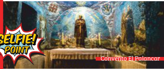
Convento El Palancar

Destaca el valor arquitectónico de pueblos como Serrejón o Romangordo. Otros enclaves son el Convento El Palancar, la ciudadela musulmana de Madinat Albalat en Romangordo, el Cristo de la Victoria en Serradilla, los castillos de Mirabel y de Monfragüe o las numerosas pinturas rupestres existentes en el territorio.