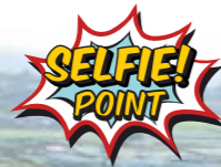
Vista de Trujillo desde el castillo

El núcleo histórico de Trujillo se alza como relevante atractivo turístico de Extremadura. La Turgalium romana dio paso a la Trujillo visigoda, árabe, judía y, por último, a la cristiana de la conquista americana. Aportó a la colonización de todo un continente hijos ilustres que construyeron palacios y conventos con el dinero obtenido en América. Sus numerosos palacios, las casas fuertes, iglesias y plazas han servido para declarar el conjunto histórico de Trujillo como Bien de Interés Cultural. Entre sus numerosos atractivos arquitectónicos destacan el castillo, la iglesia de Santa María la Mayor, el palacio de San Carlos, la casa de la Cadena... y por supuesto la magnífica plaza Mayor porticada.