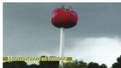
Monumento al tomate

Miajadas es la capital del tomate; aquí se cultivan y procesan cantidades ingentes de tomate para conserva. El auténtico oro rojo de la comarca.