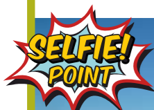
Embalse de Alcollarín