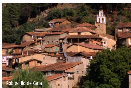
Robledillo de Gata

Debido a su carácter montañoso, en esta comarca predominan los arbustos de jara y tomillo que cubren las laderas de flores blancas y moradas. El acebo, abedul, avellano silvestre y un tipo de roble conocido como carballo son especies protegidas. Por debajo de los 800 m de altitud aparecen alcornoques, encinares y madroños.