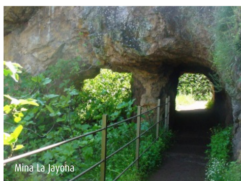
Mina La Jayona