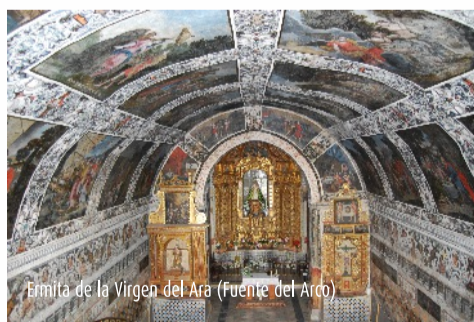
Ermita de la Virgen del Ara (Fuente del Arco)

Límites: al norte con las comarcas de La Serena y Sierra Grande- Tierra de Barros; al sur con la provincia de Sevilla; al este con Córdoba y al oeste con la comarca de Tentudía.