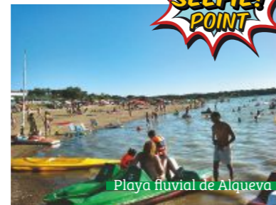
Playa fluvial de Alqueva