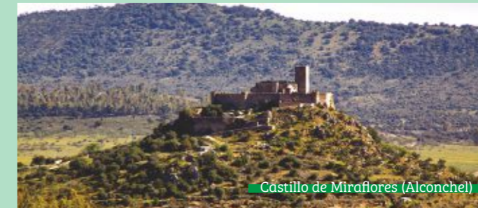
Castillo de Miraflores (Alconchel)

Obra maestra del siglo XVI de estilo manuelino, elegida "Mejor Rincón de España 2012" por La Guía Repsol.