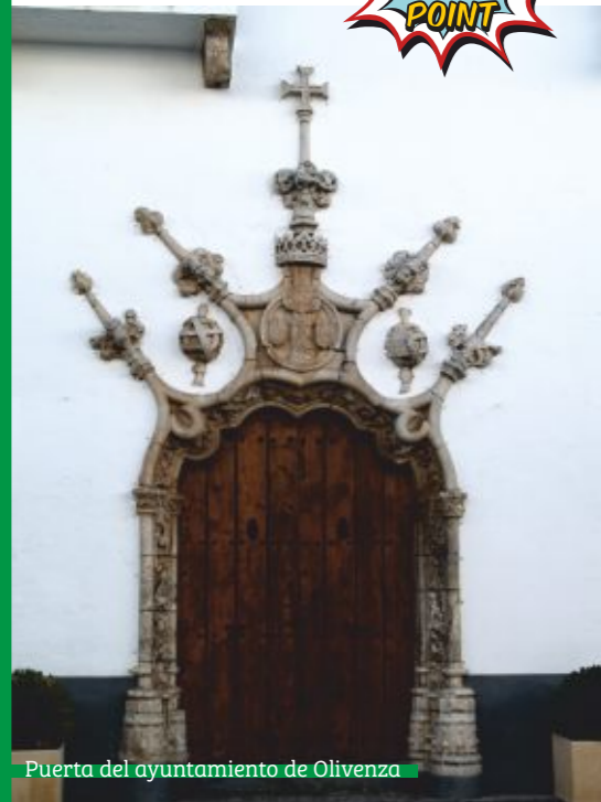
Puerta del ayuntamiento de Olivenza